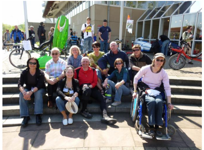
Im April 2010 auf der SPEZI (Spezialradmesse) in Gernersheim